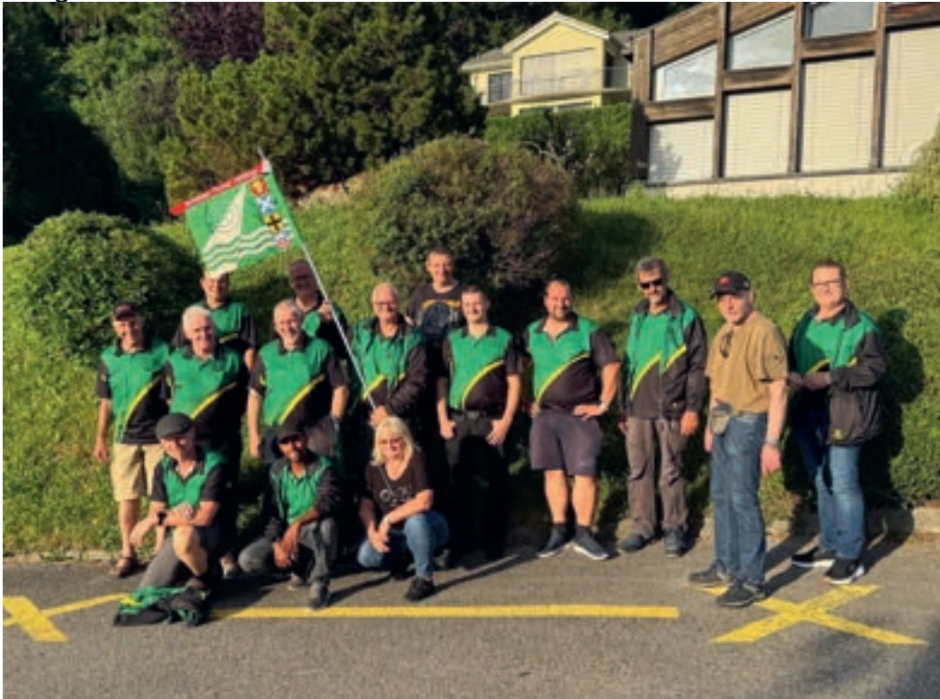
Die Schützinnen und Schützen vor dem Abendessen im Heididorf Maiefeld.