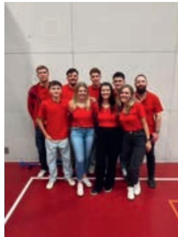
Das OK am Jubiläum

durchführen. An dieser konnten wir nicht nur unsere Riegen präsentieren, sondern gleich auch noch die Ankunft unserer neuen Vereinsfahne feiern. Unsere Halle platzte währenddessen fast aus allen Nähten, dank der vielen Besucher. An dieser Stelle ein herzliches Dankeschön an alle, die mit uns ein Bier oder Kaffee getrunken, die Chässpätzli probiert oder sonst mit uns gefeiert haben! Ihr wart ein tolles Publikum! Auch danken möchte ich für die Unterstützung der zahlreichen Sponsoren auf, die wir zählen durften! Auf der folgenden Seite. Am Ende des Berichts haben wir für euch alle noch einmal aufgelistet. Vielen Dank!