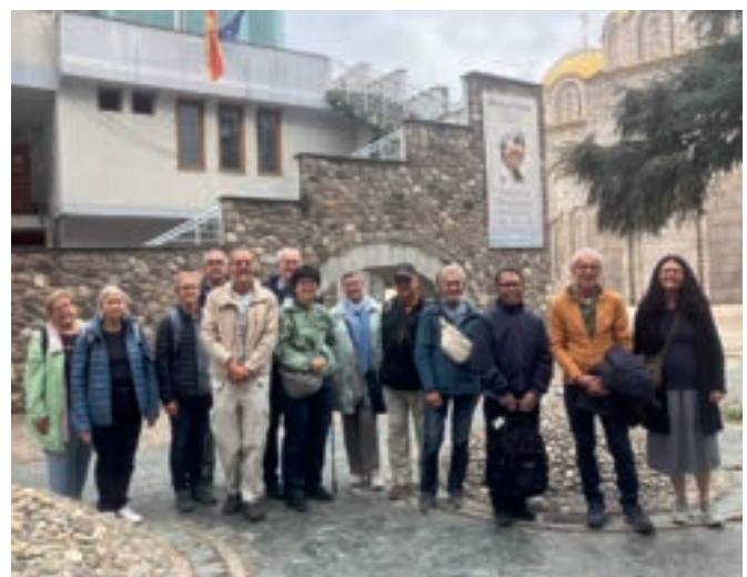
Vor dem Mutter-Teresa-Haus: die Pfarreireisenden in Skopje, Nordmazedonien.

Die Pfarreireise in den Westbalkan stand unter dem Motto «Brücken schlagen» – zwischen Geschichte, Religion, Architektur und Gegenwart. Anhand von Beispielen aus Skopje und Tirana wurde sichtbar, wie Baukunst Tradition und Moderne, Zerfall und Neubeginn, sowie kulturelle und geistliche Entwicklungen verbindet. Den ganzen Reisebericht und weitere Bilder finden Sie online.