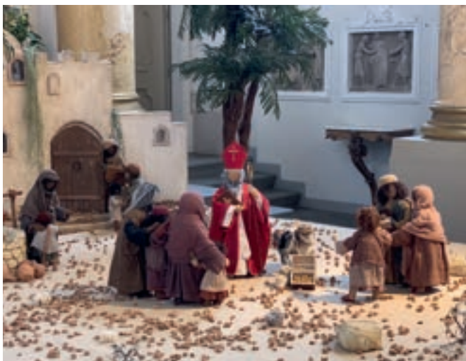
Erzählt die Weihnachtsgeschichte: die Weihnachtsskrippe in der Stadtkirche.

Aktuelle Informationen: www.kath-frauenfeldplus.ch/advent