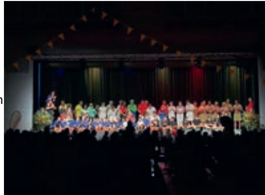
Unsere Riegen am Jubiläum

Die Saison hat für die Handballer*innen aus Felben-Wellhausen im September begonnen. Die FU16-Juniorinnen, waren dabei sehr erfolgreich. Ihr erstes Spiel konnten sie am 31. August mit 29:24 gegen den KTV Wil Kathi gewinnen. Im nächsten und übernächsten Spiel gewinnen sie mit 29:24 gegen Amriswil und 43:29 gegen die Lakers Romanshorn zwei Spiele sehr deutlich! Nach 8 Spielen sind sie in einer umkämpften Liga mit 11 Punkten auf dem ersten Zwischenrang.